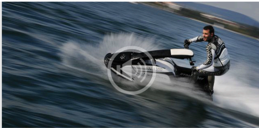
Le Journal du matin - La mobilisation s'organise contre les jet-skis sur le Léman