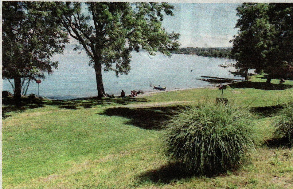
La commune d'Anthy songe à l'installation d'un parc nautique sur la plage des Recorts.

Reste que l'installation de ces animations ne paraît pas être une petite affaire. « Cette structure nécessite une surface d'environ 10 m 2 sur la plage pour l'implantation de l'accueil et un branchement électrique. Sur l'eau nous avons besoin d'une surface de 40 mètres sur 35 avec la pose de corps morts au fond pour l'amarrage du parc », explique-t-on dans la délibération. Quant à l'emplacement de cette future attraction lacustre, rien est encore fixé. « On doit étudier tout cela notamment avec le